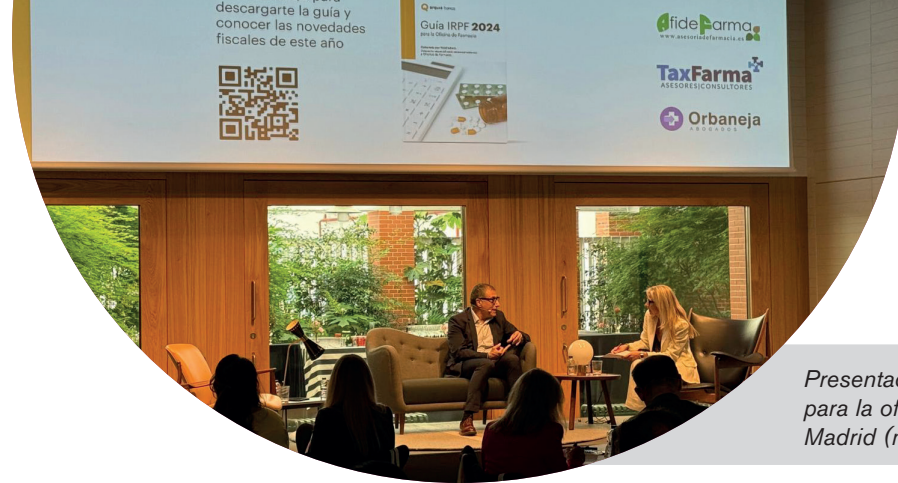
Presentación de la Guía IRPF para la oficina de farmacia - Madrid (mayo)

Nuestro propósito es acompañar a nuestros clientes en la toma de decisiones financieras, facilitándoles conocimientos prácticos y comprensibles, promoviendo hábitos responsables, la planificación a largo plazo y la protección frente a riesgos cotidianos.