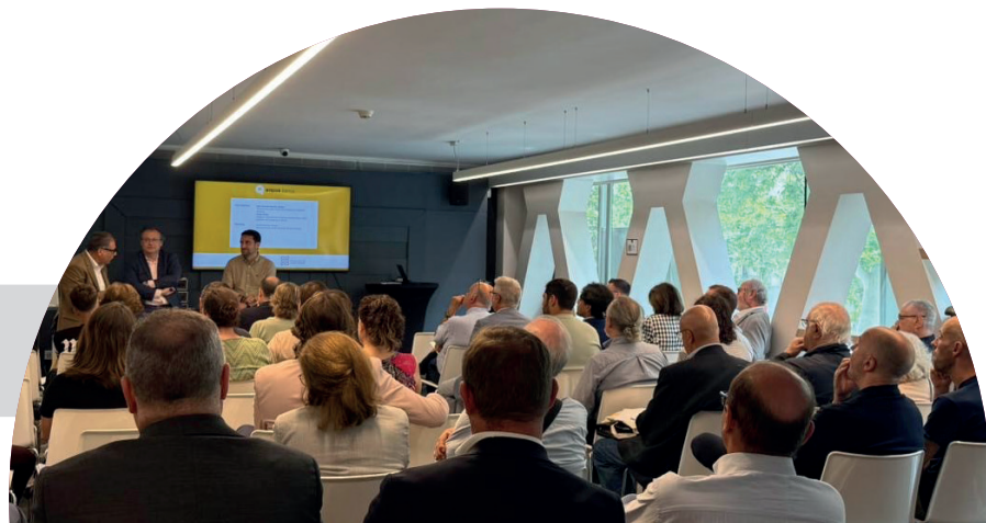
Presentación de la Guía IRPF para la oficina de farmacia - Barcelona (mayo)

Por segundo año consecutivo, Arquia ha presentado la "Guía IRPF para la oficina de farmacia" editada por el banco y elaborada por el prestigioso despacho TAXFARMA. Esta guía tiene un doble objetivo: actualizar la información de la que dispone el farmacéutico sobre la legislación aplicable en su próxima Declaración del IRPF, e informar al farmacéutico sobre todas las novedades que van aconteciendo en este ámbito, con un estilo claro y cercano.